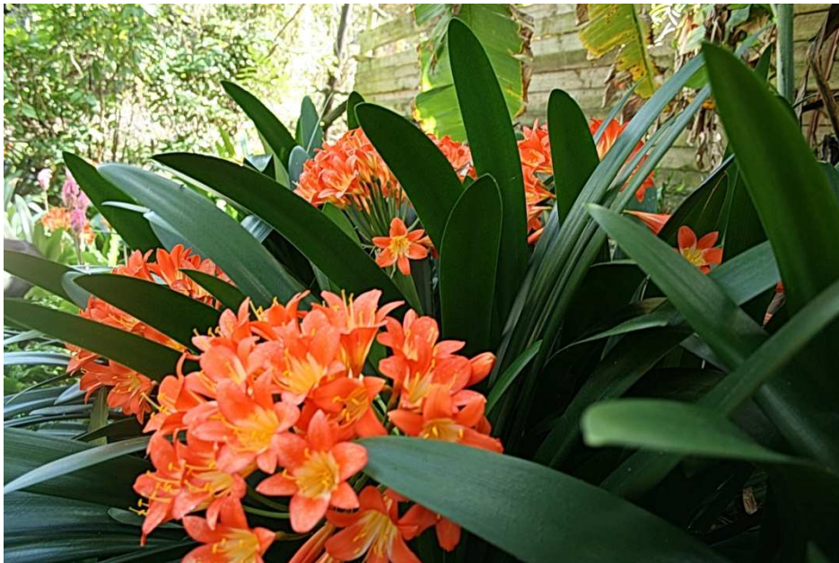
Clivias: 'n pragtige gesig in die lente in die Valleï.